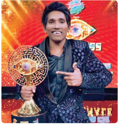
बिग बॉसची टॉफीसुद्धा 'झापुक-झूपूक' स्टॉईलने बारामतीतच आली की...