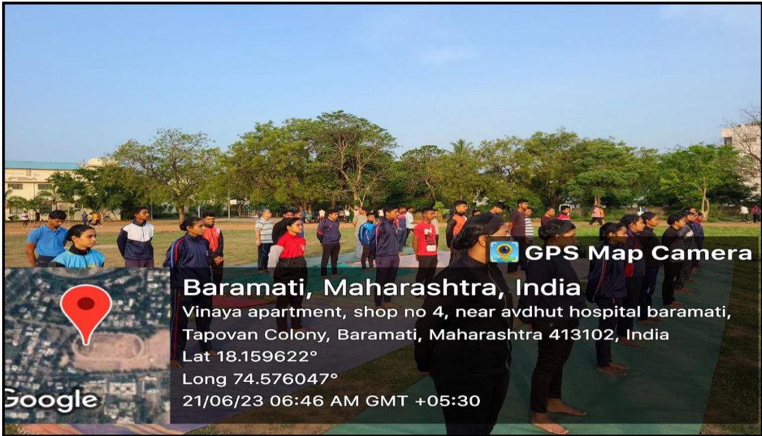
Student’s active participation on International Yoga Day