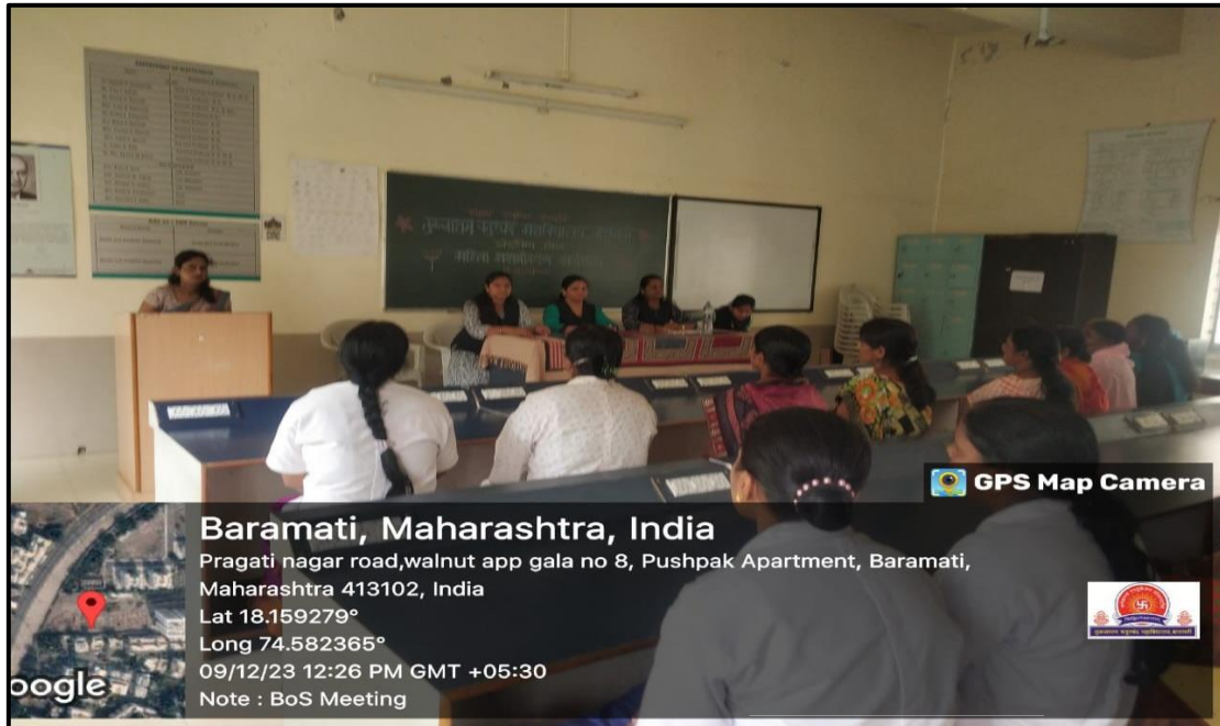
Inauguration of the workshop for Non teaching women staff of the college