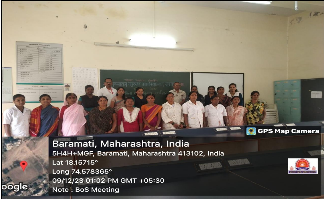
Group photo of participant women workers with the organizing committee