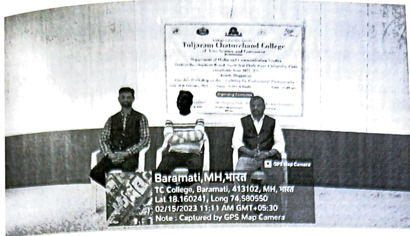
Inaugurations of Lighting for Professional Photography workshop