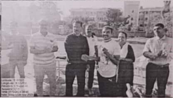
Sport day celebration: Prize Distribution