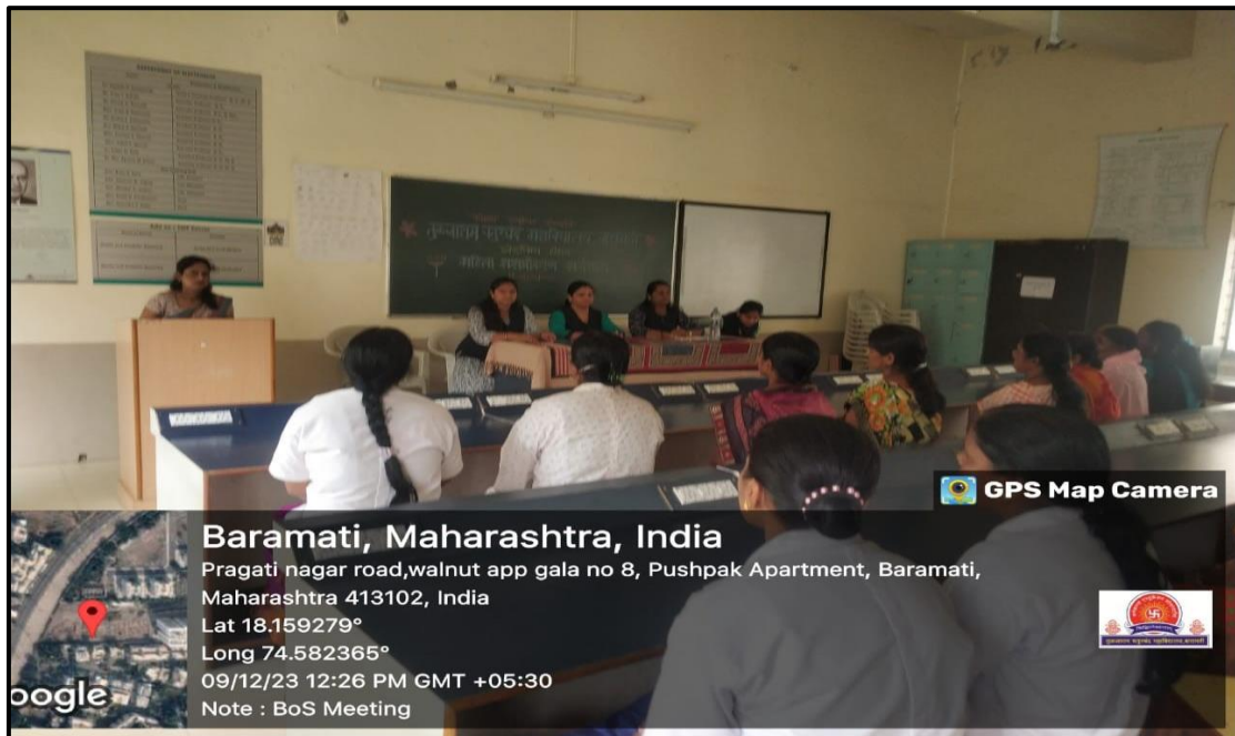
Inauguration of the workshop for Non teaching women staff of the college