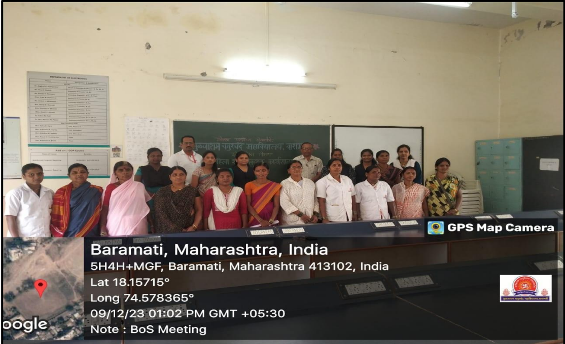
Group photo of participant women workers with the organizing committee